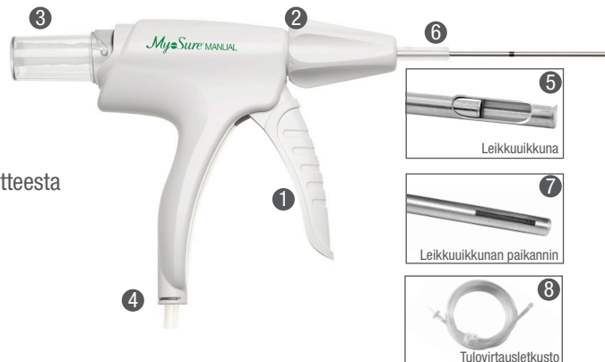
Kuva 1: MyoSure MANUAL -kudoksenpoistolaite